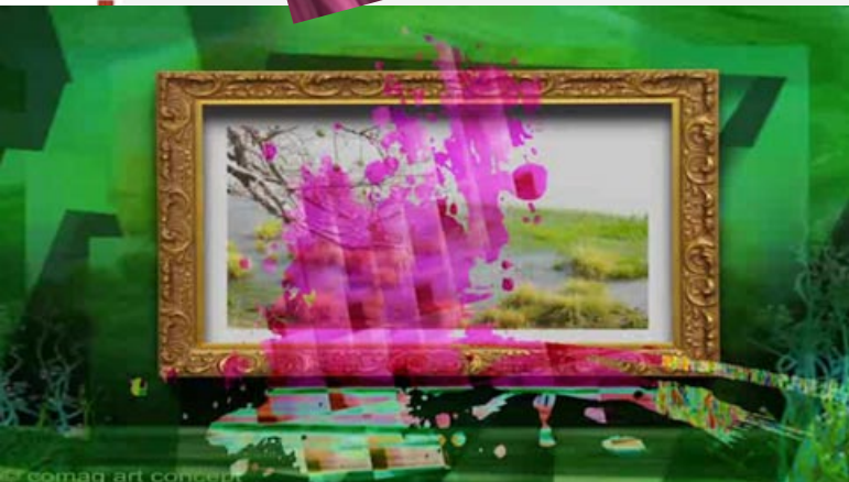
g art concept

W.A. Mozart und I. Stravinsky will be performed by: