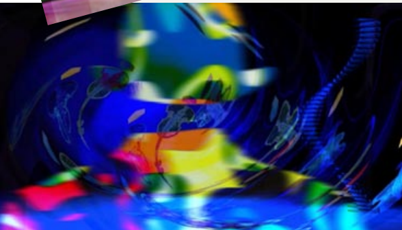
3 animated stage sets