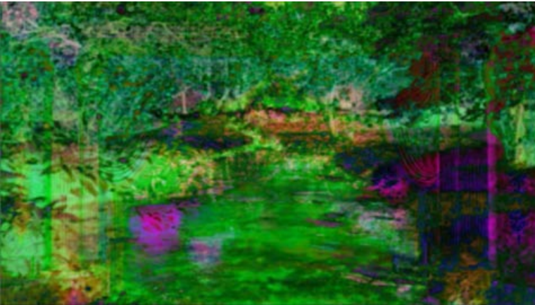
stage sets: Brahms & Stravinski, Gavotta

P. de Sarasate Airs bohémiens/ Gipsy Airs