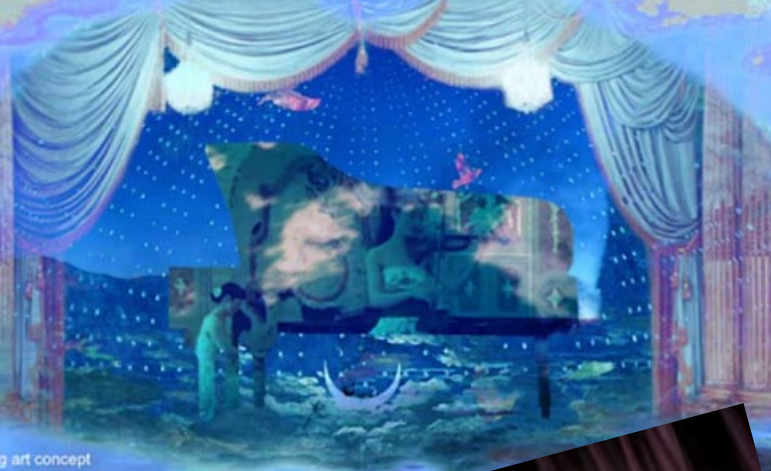
g art concept