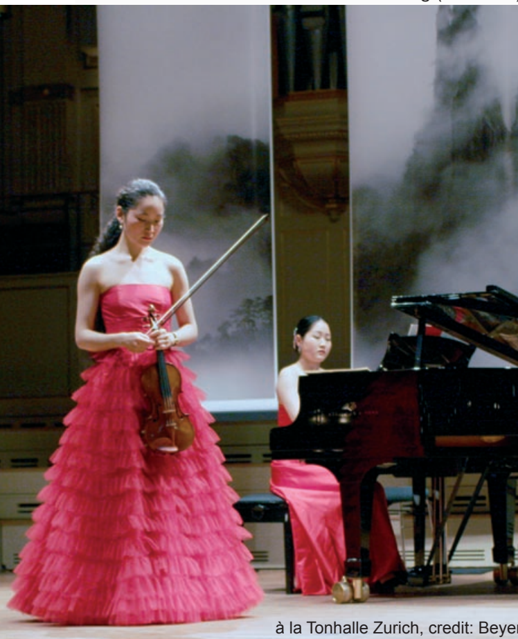
à la Tonhalle Zurich, credit: Beyer

terweys audio meet visual ballet art performance www.berenice-christin-terwey.de