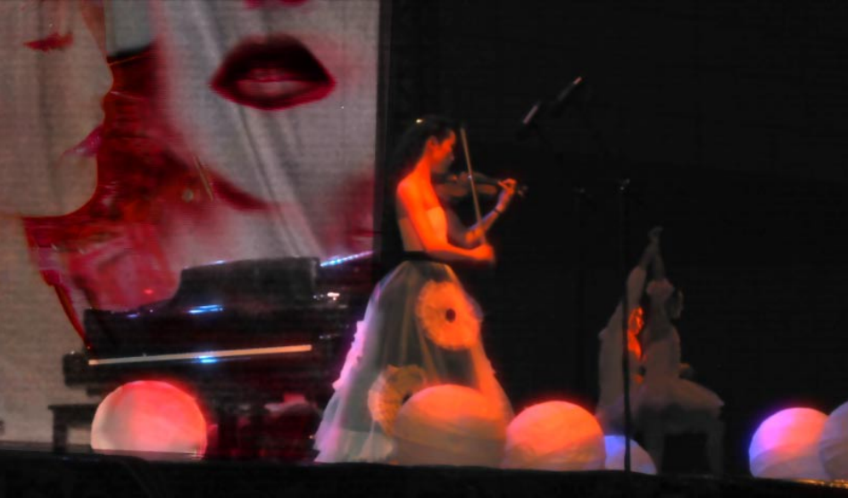
open air at the Festival Int. de Sta. Lucia