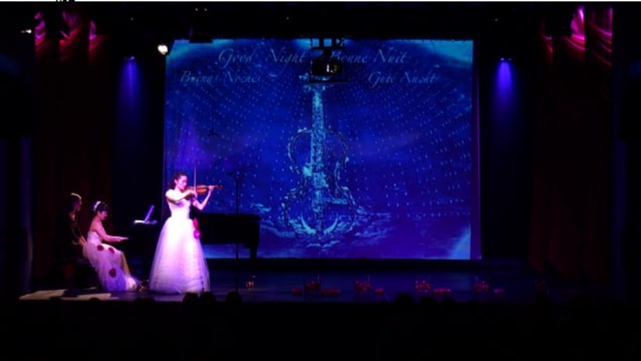
left: ENCORE, SALUT D'AMOUR right: SARASATE GIPSY AIRS

stage set with video animations and 6 red curtains