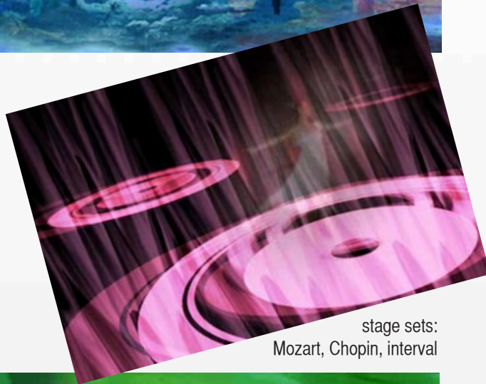
stage sets: Mozart, Chopin, interval